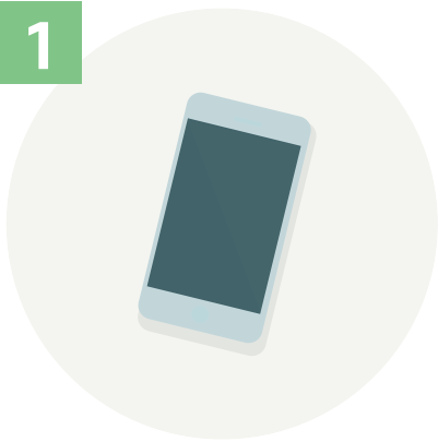
GPS 켜진 스마트폰